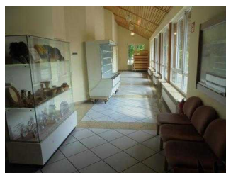
Flur Teil 2