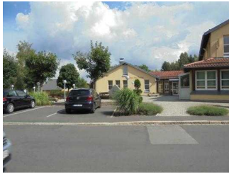
Parkplatz + Weg