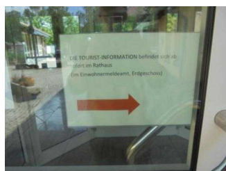
Beschilderung am Haupteingang