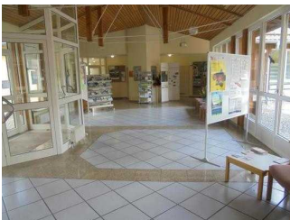
Flur durch das Foyer, Teil 1

Flur durch das Foyer zum WC, zur Flyer-Ecke, zum Veranstaltungsraum und Leseraum