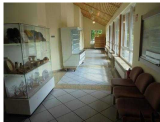
Flur Teil 2