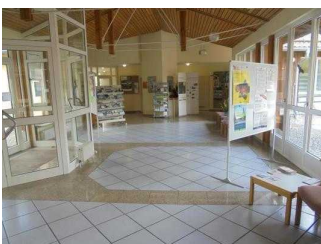
Flur durch das Foyer, Teil 1

Flur durch das Foyer zum WC, zur Flyer-Ecke, zum Veranstaltungsraum und Leseraum